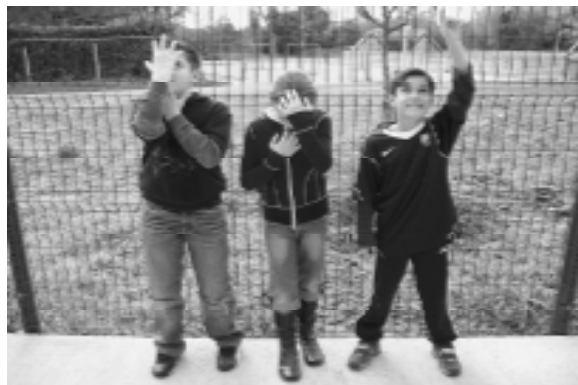
Il n'y a pas d'âge pour s'y mettre, comme le prouvent nos rédacteurs

Grâce au travail collectif de recherche, vous pourrez découvrir cette 5 ème édition de « L'école enchaînée » : des sujets aussi divers que variés tels que la tecktonik, les vikings, l'impressionnisme, des documents animaliers.