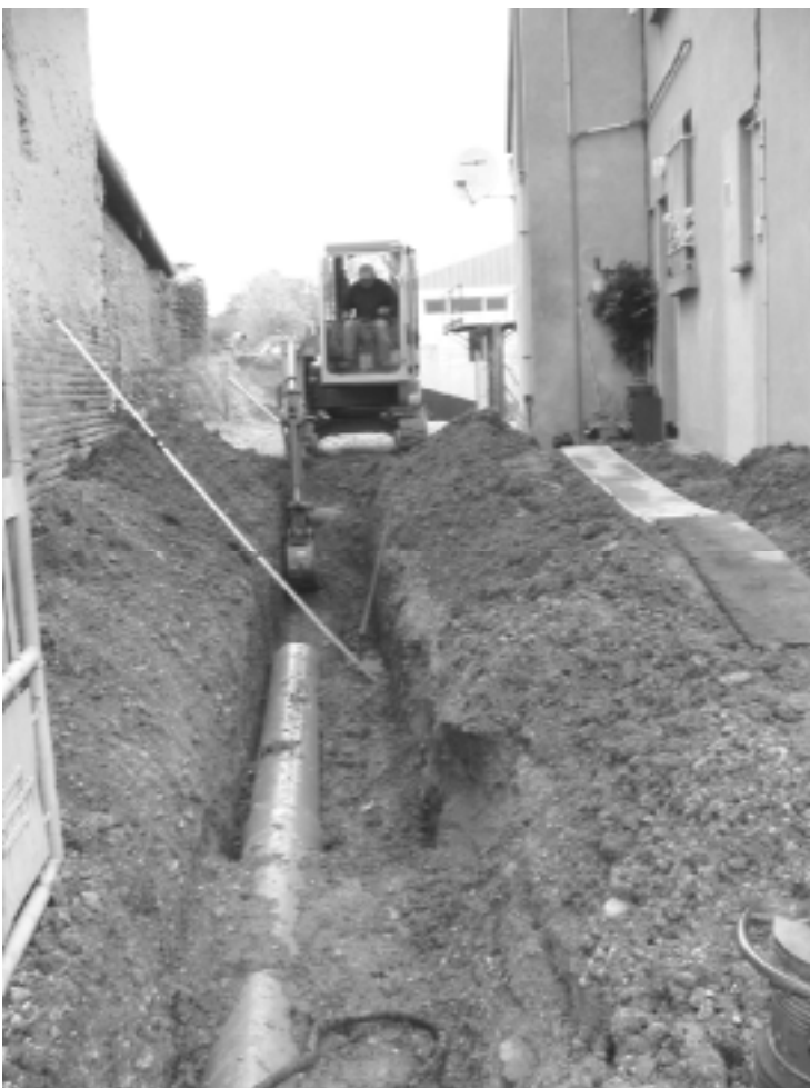
Parallèlement, l'entreprise Jouve-Assoulant réalise les travaux de raccordement aux différents réseaux (assainissement, pluvial, téléphone)