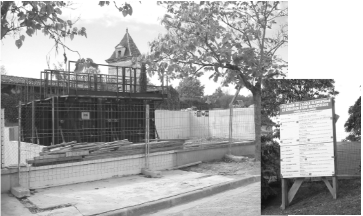
Ecole Médiathèque : après les terrassements, les murs sortent de terre.