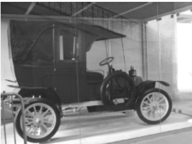
Le célèbre Taxi de la Marne