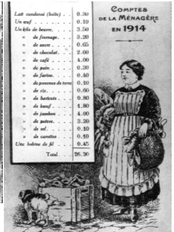
Le coût du panier de la ménagère en ce début de l'année 1914. On verra par la suite, au fil des ans, les prix s'envoler.