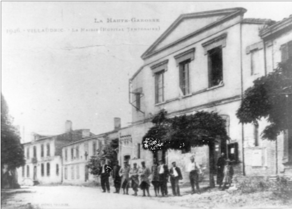
La salle de la Mairie est transformée en salle d'hôpital. Les blessés en convalescence sont soignés par le docteur Arnoul.